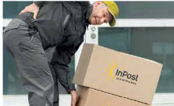
нещасний випадок на виробництві