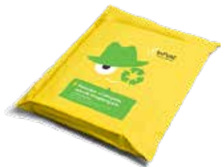
Пакети з поліетилену

У магазині InStore https://inpoststore.com ви можете придбати упаковку та матеріали, які відповідають усім вимогам операційного процесу InPost.