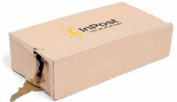
упаковка з рідиною, що протікає