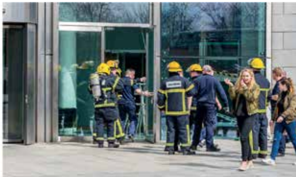
евакуація відділу пошти