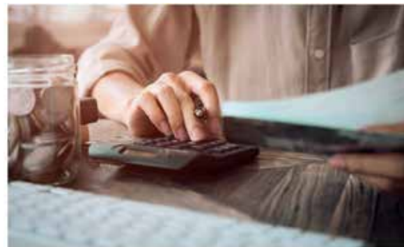
додаткові витрати для клієнта