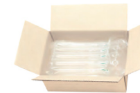
Woreczki z pianką rosnącą