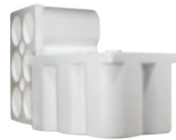
Arkusze z pianki