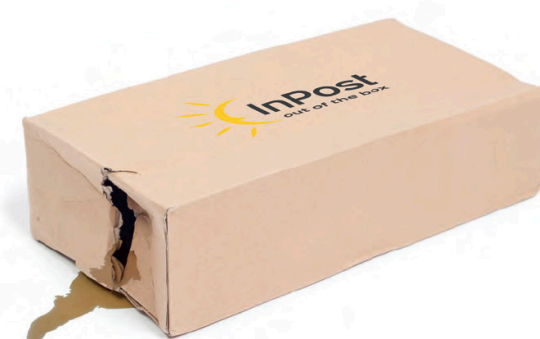
paczka z wyciekającym płynem