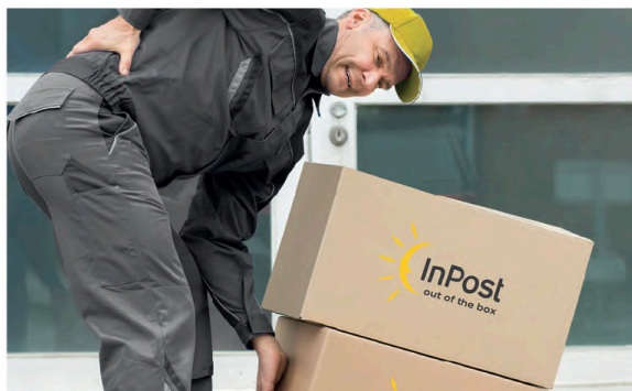
wypadek przy pracy